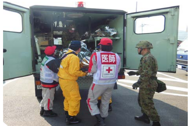
被災者搬送訓練 【地下鉄橋本駅】