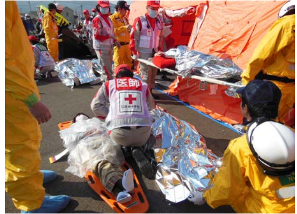
応急救護訓練 【地下鉄橋本駅】