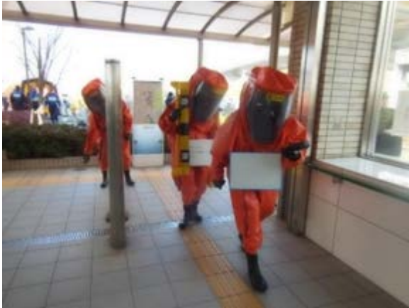
初動対応訓練（検知・ゾーニング） 【地下鉄橋本駅】