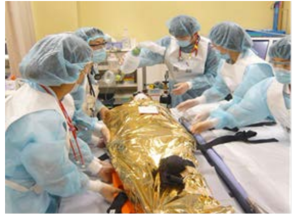
医療救護訓練 【福岡赤十字病院】