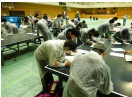
救援訓練 【福岡市立西体育館】