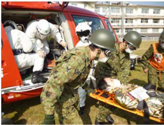
被災者受入訓練 【自衛隊福岡病院】