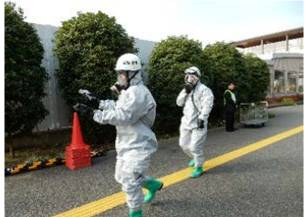
初動対応訓練（通気口等周辺検知） 【地下鉄橋本駅】