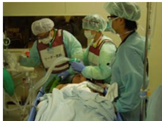
医療救護訓練 【福岡大学病院】