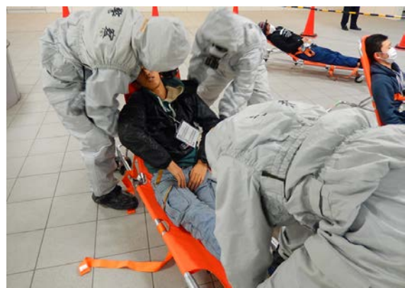
初動対応訓練（救出・救助） 【地下鉄橋本駅】