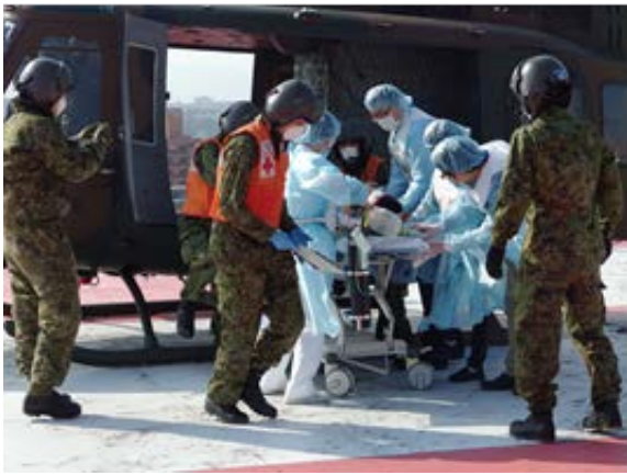
被災者受入訓練 【福岡赤十字病院】