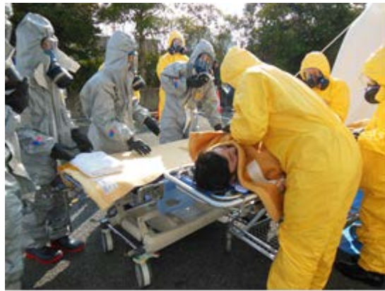
被災者受入訓練 【九州医療センター】