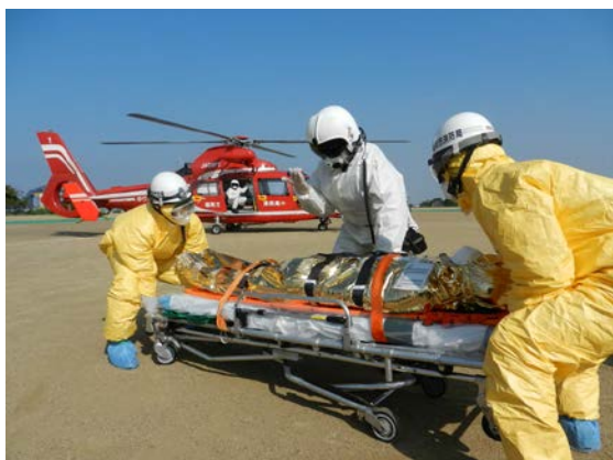
被災者搬送訓練 【西部運動公園（臨時ヘリポート）】