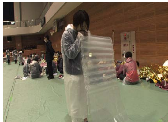
救援訓練 【福岡市立西体育館】