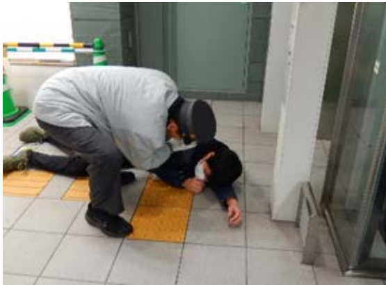
初動対応訓練（被災者対応） 【地下鉄橋本駅】