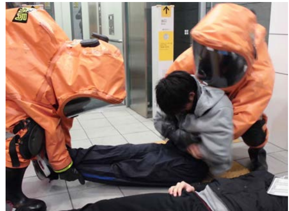
初動対応訓練（救出・救助） 【地下鉄橋本駅】