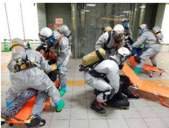
初動対応訓練（救出・救助） 【地下鉄橋本駅】