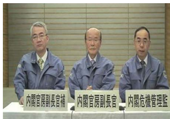
T V会議運営訓練 【総理大臣官邸】