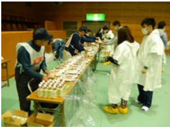
救援訓練 【福岡市立西体育館】