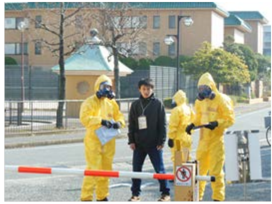
被災者受入訓練 【九州医療センター】