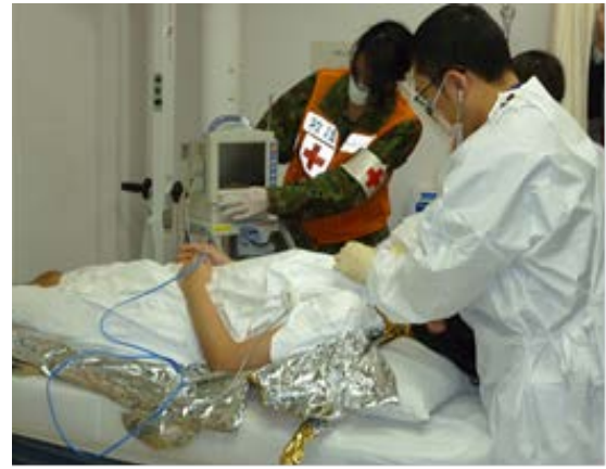
医療救護訓練 【自衛隊福岡病院】