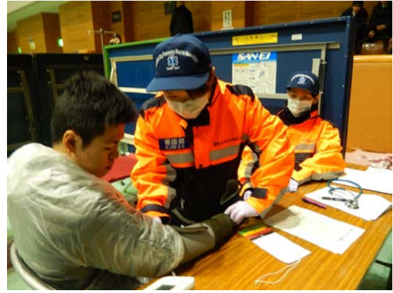
救援訓練 【福岡市立西体育館】