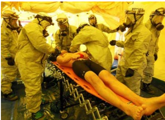
除染訓練（湿式除染） 【地下鉄橋本駅】