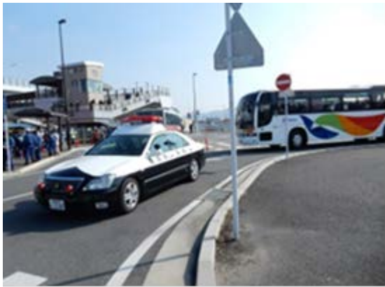
被災者搬送訓練 【地下鉄橋本駅～福岡市立西体育館】