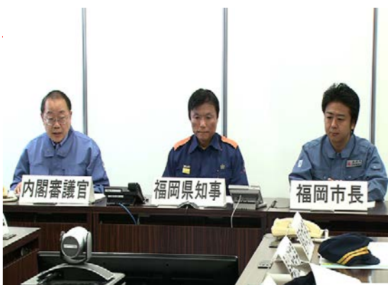
T V会議運営訓練 【福岡県庁】