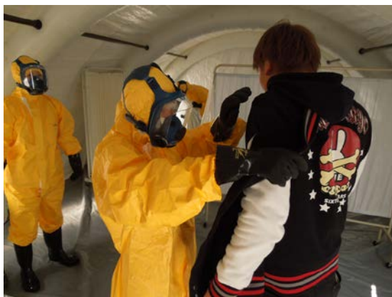
被災者受入訓練 【福岡大学病院】