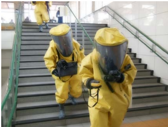
初動対応訓練（検知・検索） 【地下鉄橋本駅】