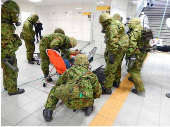
初動対応訓練（救出・救助） 【地下鉄橋本駅】