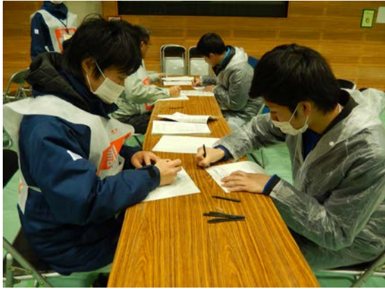
救援訓練 【福岡市立西体育館】