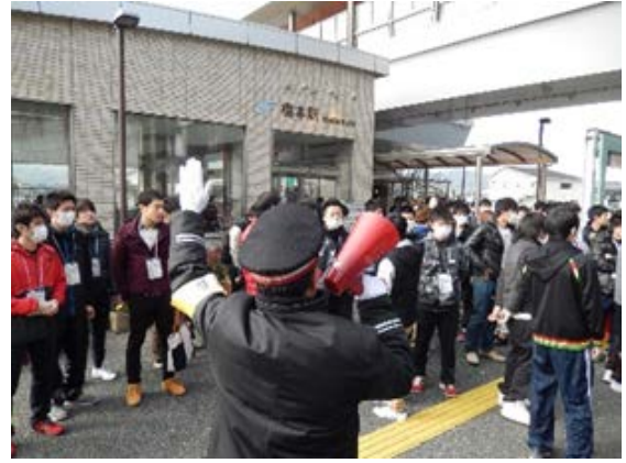
初動対応訓練（避難誘導） 【地下鉄橋本駅】