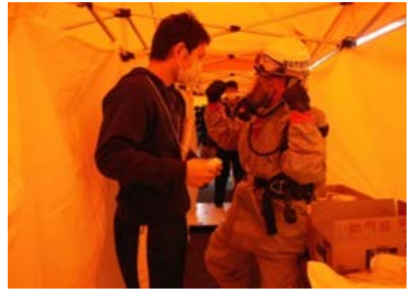
除染訓練（乾式除染） 【地下鉄橋本駅】