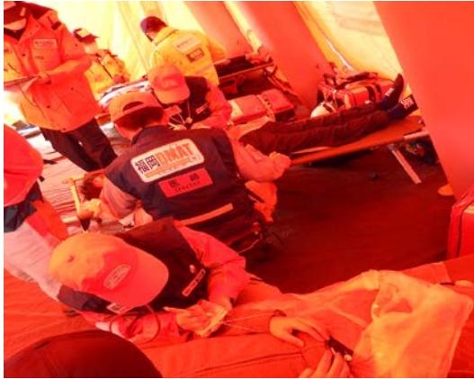
応急救護訓練 【地下鉄橋本駅】