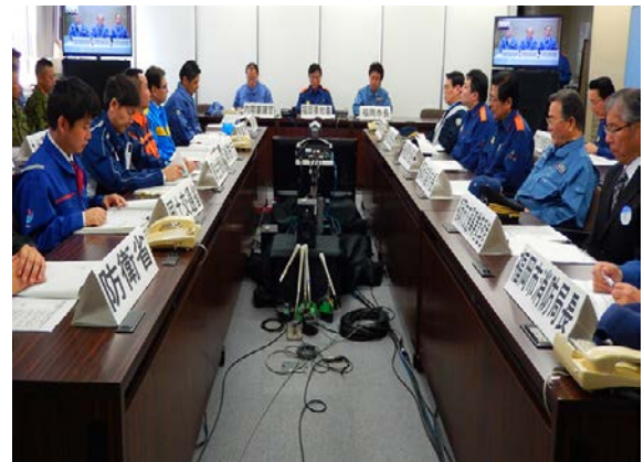
合同対策協議会運営訓練 【福岡県庁】