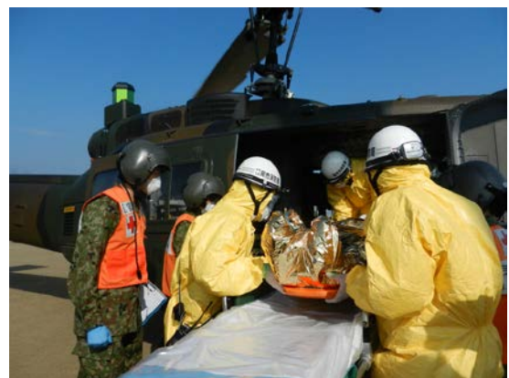
被災者搬送訓練 【西部運動公園（臨時ヘリポート）】