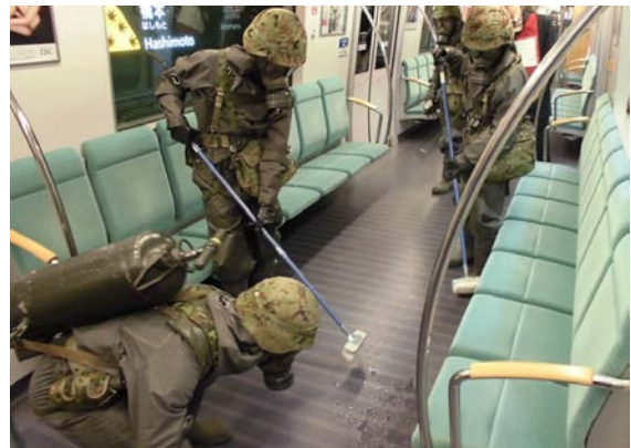
除染訓練（現場除染） 【地下鉄橋本駅】