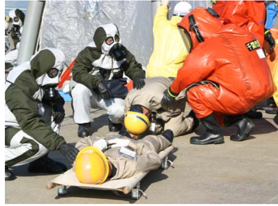
化学剤による負傷者の救助（警察、消防）【千葉港】