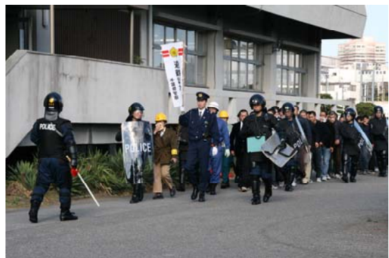
住民避難（一次集合場所から二次集合場所へ徒歩で 移動）【千葉みなと地区】