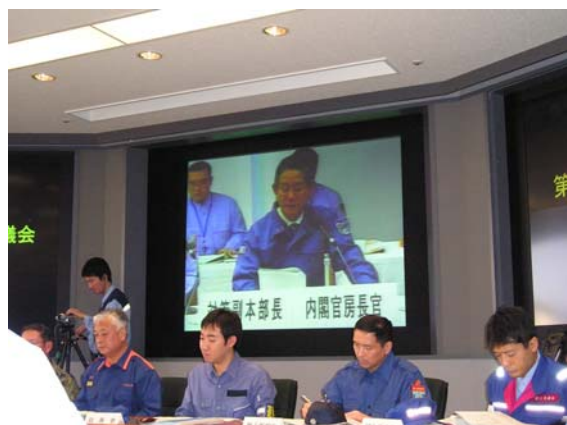
官邸とのTV会議（官邸の町村内閣官房長官） 【千葉県庁】