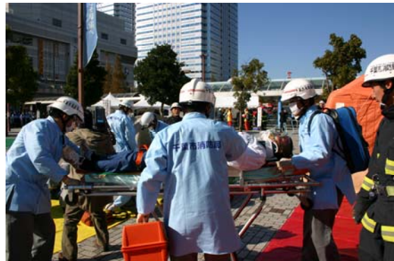
爆破テロによる負傷者の搬送（消防） 【海浜幕張駅前】