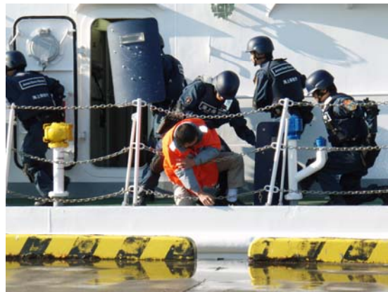
武装グループの鎮圧（海上保安庁）【千葉港】