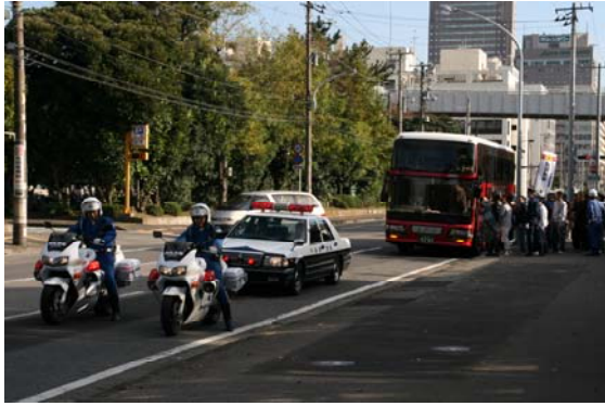
住民避難（二次集合場所でバスに乗車） 【千葉みなと地区】