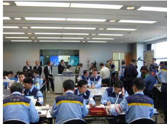
県対策本部の活動状況【千葉県庁】