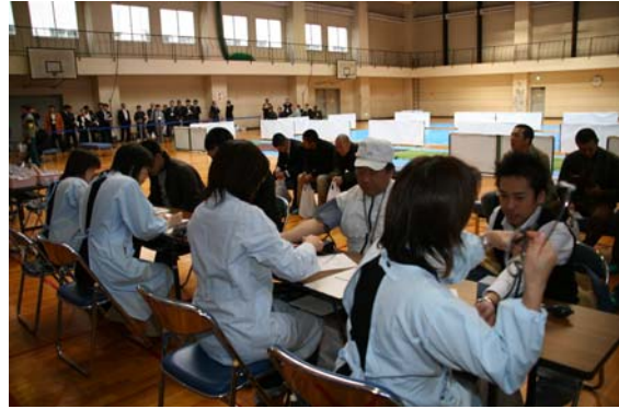
避難所における避難住民の健康調査 【千葉中央コミュニティセンター】