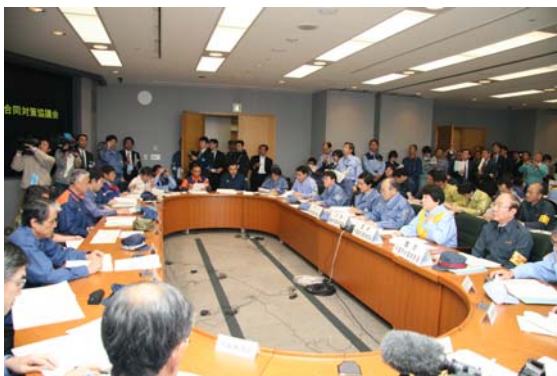
合同対策協議会の状況【千葉県庁】