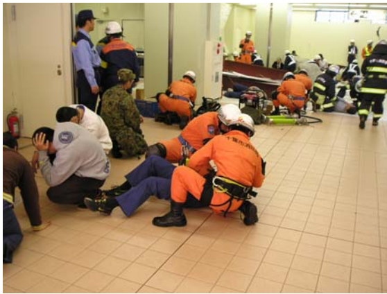
爆破テロによる負傷者の救助（消防） 【海浜幕張駅構内】