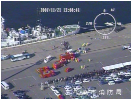
千葉港での訓練の状況【千葉港】