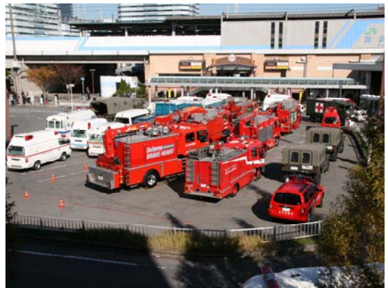
集結した緊急車両【海浜幕張駅】