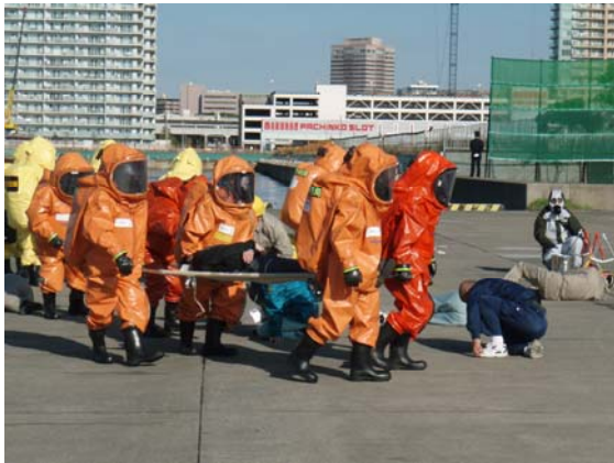
化学剤による負傷者の救助（消防）【千葉港】