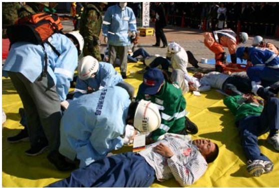
爆破テロによる負傷者のトリアージ（消防） 【海浜幕張駅前】