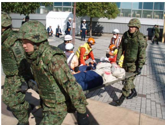
爆破テロによる負傷者の搬送（自衛隊） 【海浜幕張駅前】