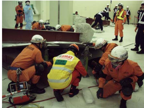
爆破テロによる負傷者に対するがれき下の医療活動 （DMAT）【海浜幕張駅構内】