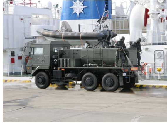
エリア除染（自衛隊）【千葉港】