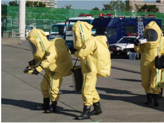
化学剤の検知（警察）【千葉港】