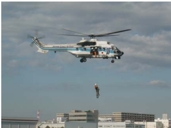
不審貨物船の人質救出（海上保安庁）【千葉港】