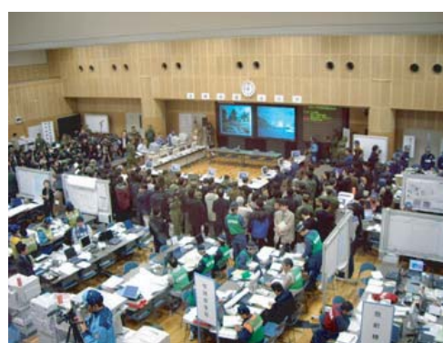
現地対策本部全体状況