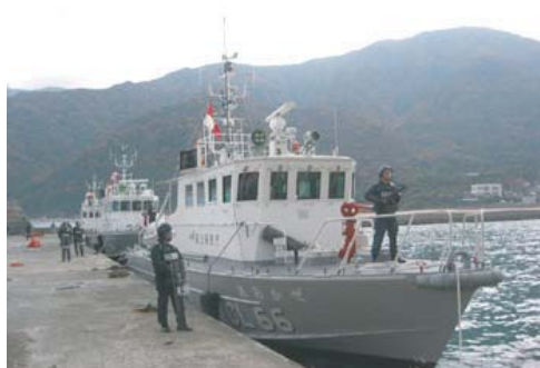
海上保安庁による海上避難誘導の状況