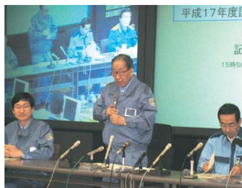
杓掛有事法制担当大臣記者会見