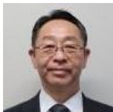
福岡 弘毅 大分県 生活環境部防災局 防災危機管理監