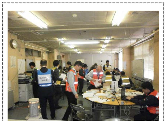
対策本部の活動 (青森市)