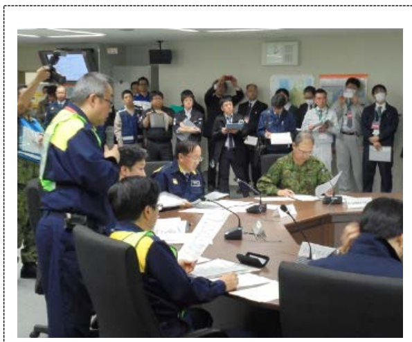
緊急対処事態対策本部員会議 (青森県)