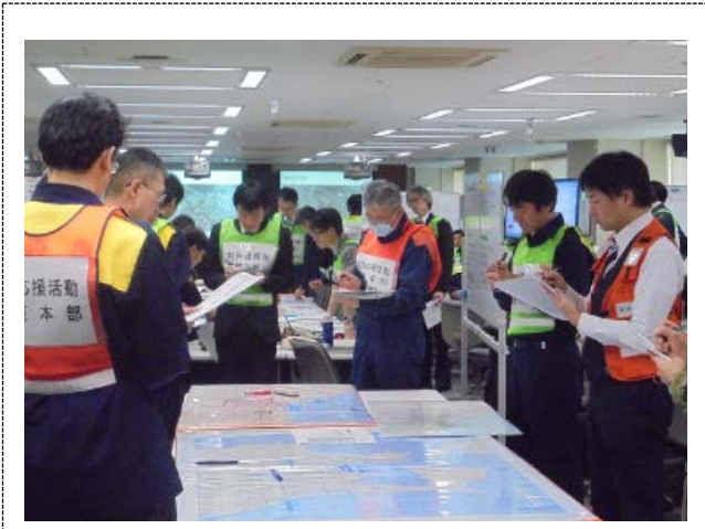
対策本部の活動 (青森県)