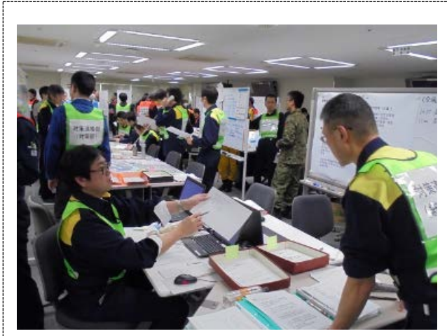
対策本部の活動 (青森県)