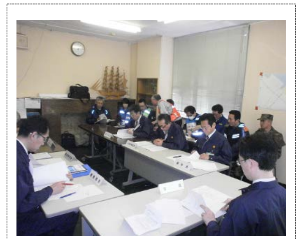
緊急対処事態対策本部員会議 (青森市)