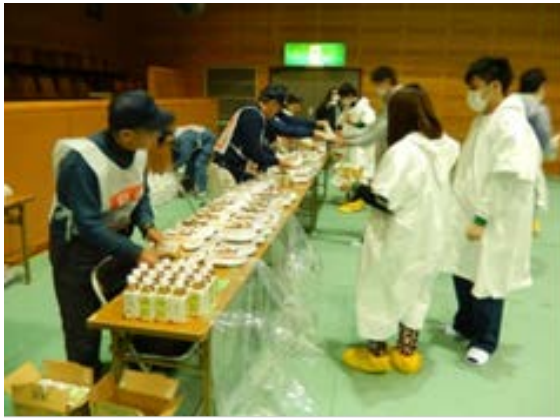
救援訓練 【福岡市立西体育館】