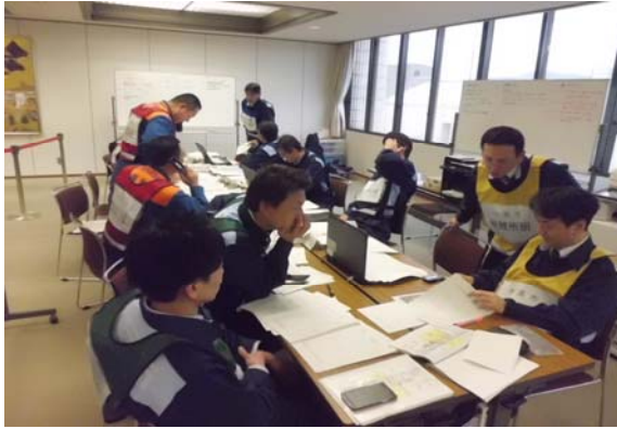
小浜市対策本部（事務局）の状況