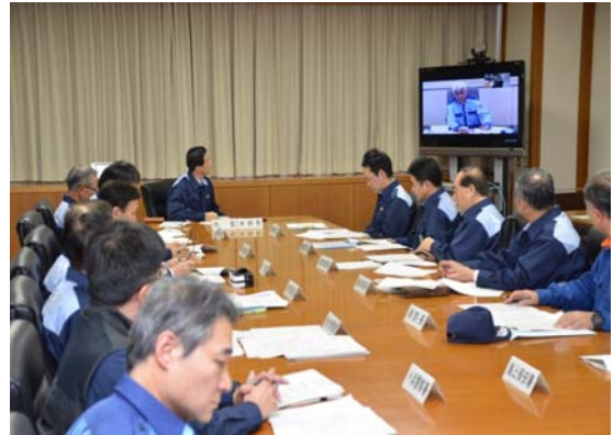
小浜市対策本部会議の状況