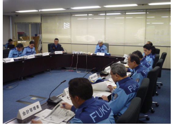
福井県対策本部会議の状況