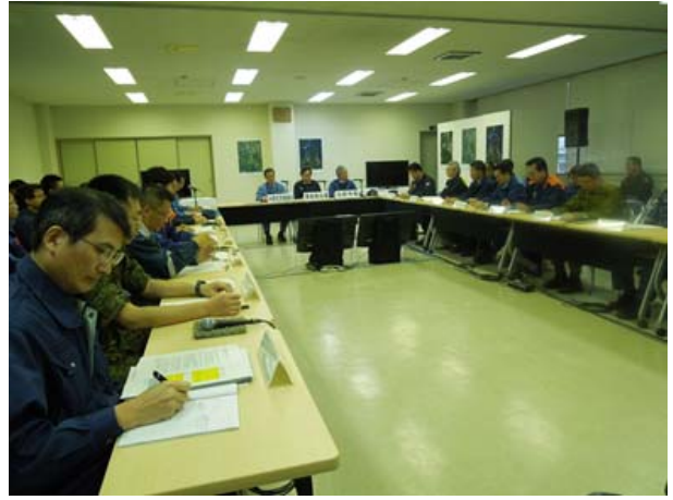
合同対策協議会運営訓練【青森県弘前合同庁舎】