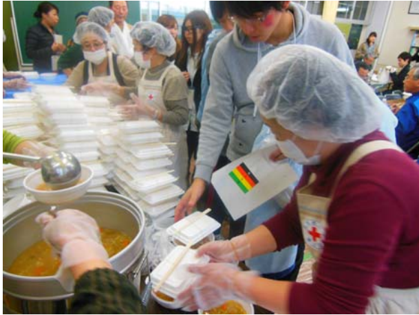
避難所運営訓練（給食） 【弘前市立東小学校会議室】