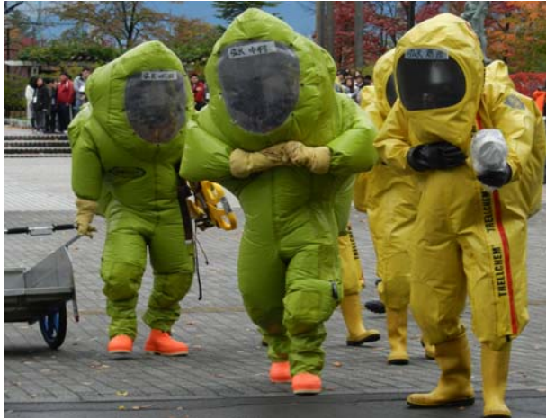
初動対処訓練（NBC簡易検知） 【弘前市運動公園】