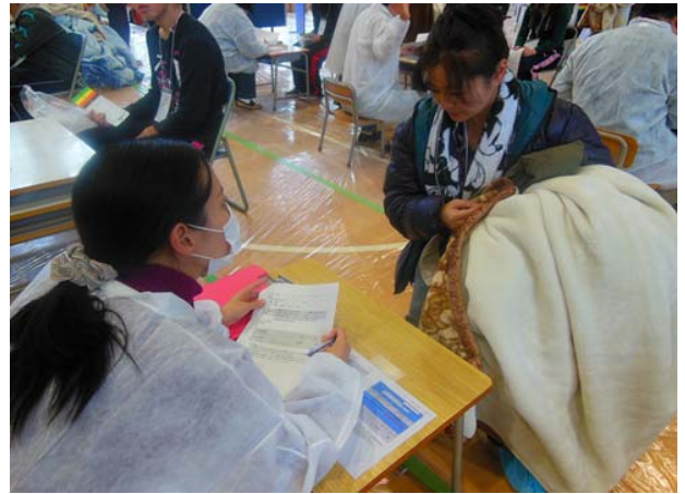
避難所運営訓練（問診） 【弘前市立東小学校体育館】