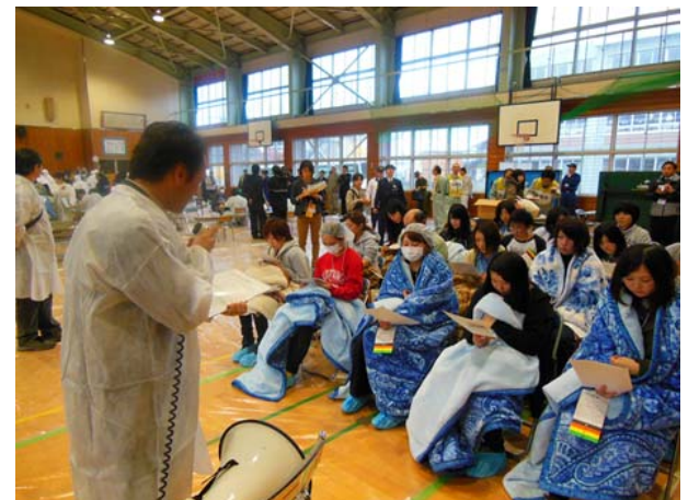
避難所運営訓練（リスクコミュニケーション） 【弘前市立東小学校体育館】