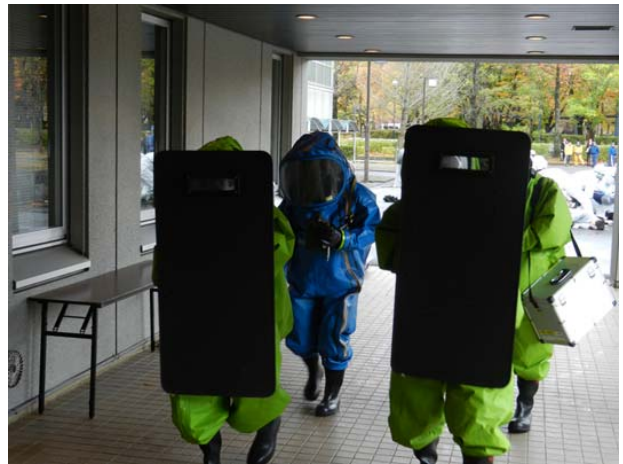
初動対処訓練（検知・検索） 【弘前市運動公園】