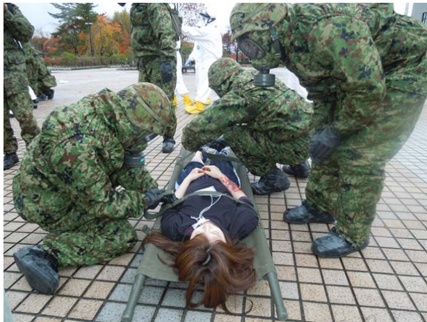
初動対処訓練（救出・救助） 【弘前市運動公園】