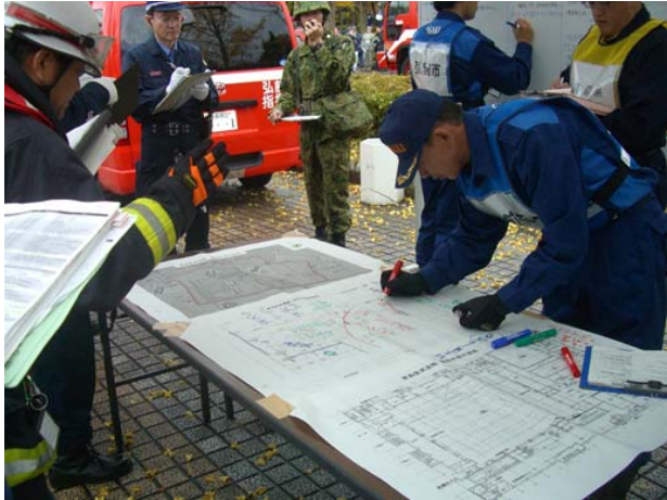
現地調整所運営訓練【弘前市運動公園】