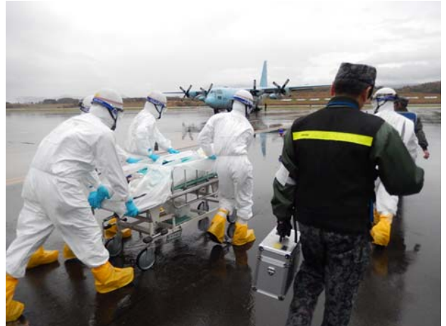
SCU運営訓練【青森空港】