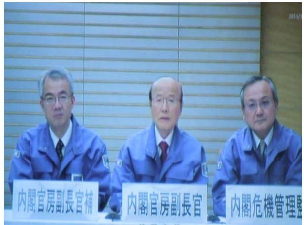
T V会議運営訓練【総理大臣官邸】