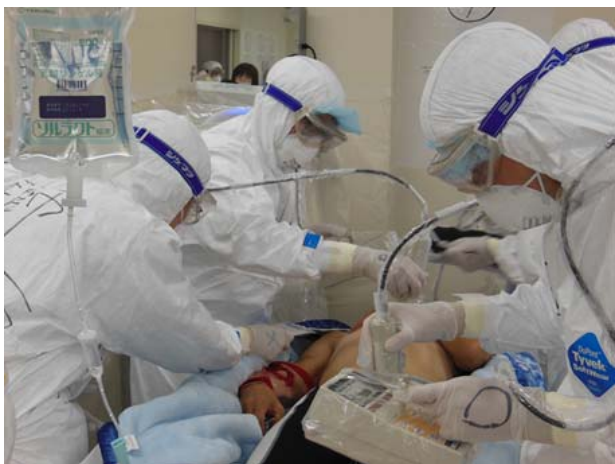
医療救護訓練【弘前大学医学部附属病院】