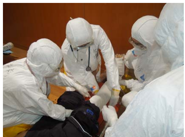
応急救護訓練【弘前市運動公園】