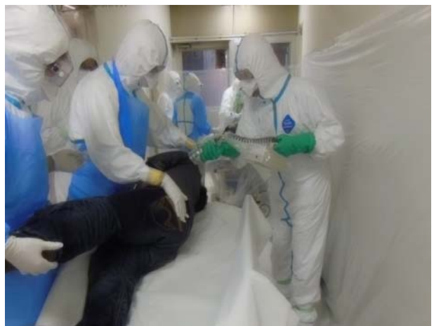
負傷者受入訓練【弘前市立病院】