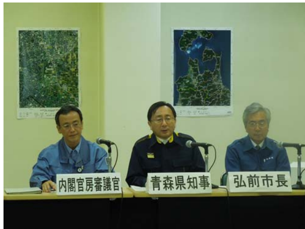
T V会議運営訓練【青森県弘前合同庁舎】