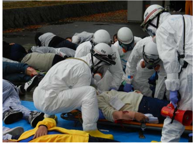
初動対処訓練（救出・救助） 【弘前市運動公園】