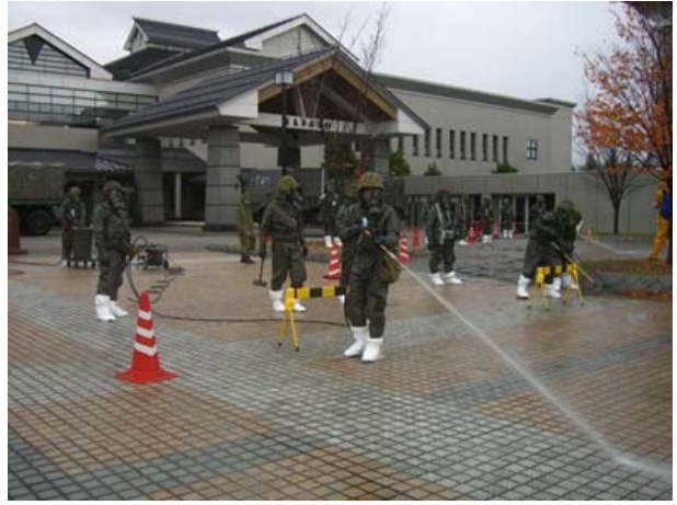
初動対処訓練（現場除染）【弘前市運動公園】