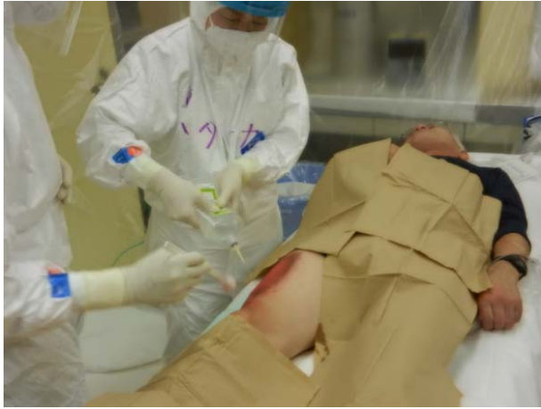
医療救護訓練【青森県立中央病院】