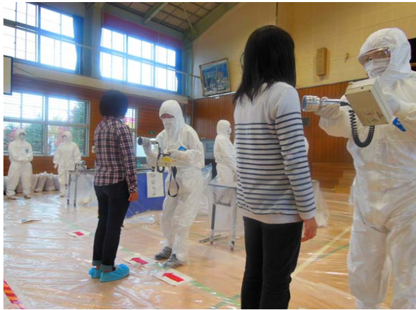
避難所運営訓練（外部汚染のスクリーニング） 【弘前市立東小学校体育館】