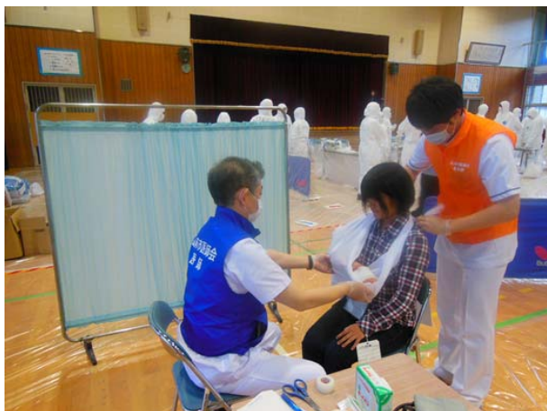
避難所運営訓練（医療救護） 【弘前市立東小学校体育館】