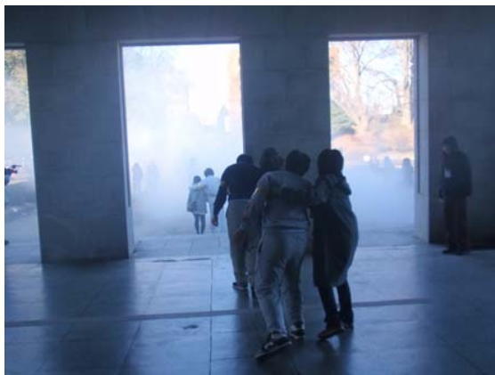
発災場所からの退避