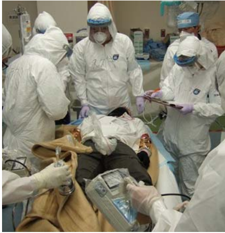
病院での医療救護訓練