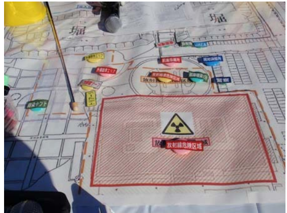
現地調整所運営訓練