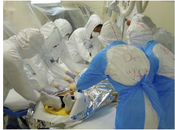
病院での医療救護訓練