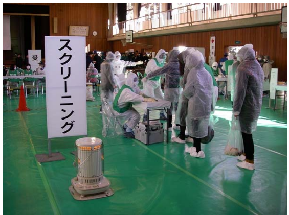
救護所・避難所でのスクリーニング