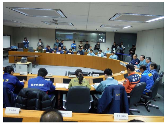
合同対策協議会運営訓練