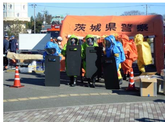
部隊による発災現場への進入