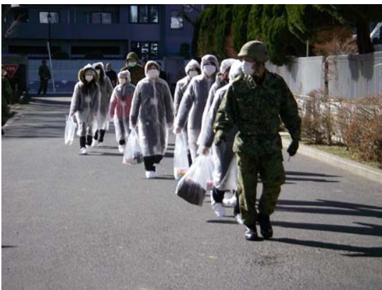
被災者の避難・誘導