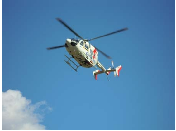
ドクターヘリによる患者搬送