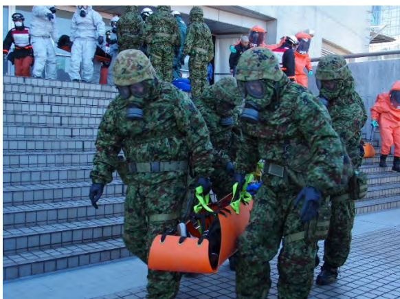
初動対応訓練（救出・救助） 【幕張メッセ】