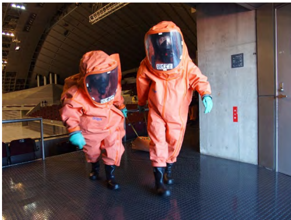
初動対応訓練（救出・救助） 【幕張メッセ】