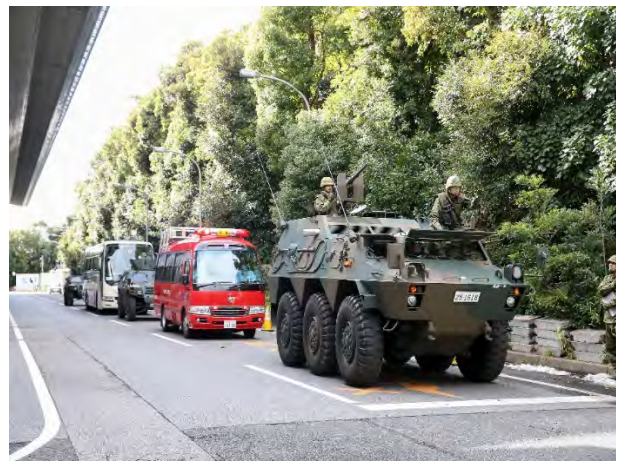
被災者搬送訓練 【幕張メッセ】