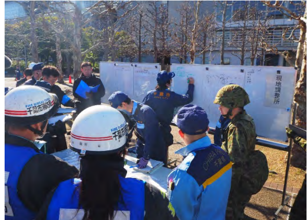
現地調整所運営訓練 【幕張メッセ】