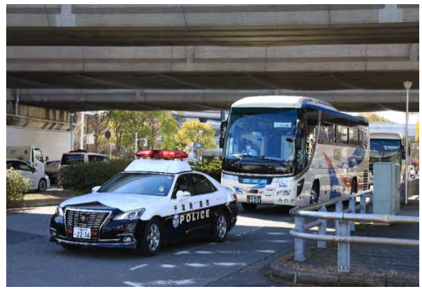
被災者搬送訓練 【ワールドビジネスガーデン →幕張コミュニティセンター】