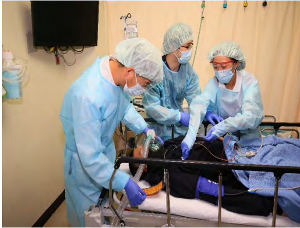
医療救護訓練 【千葉県救急医療センター】