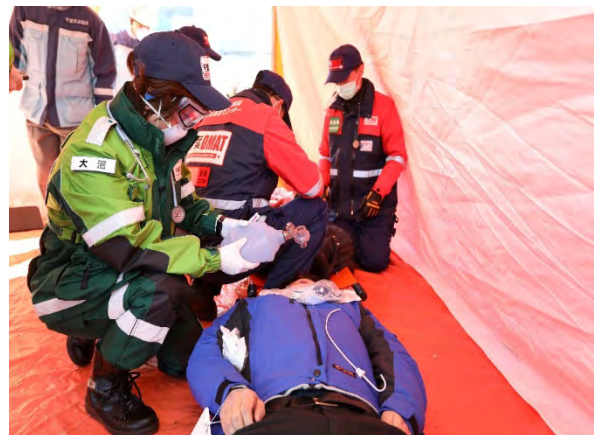
応急救護訓練 【幕張メッセ】