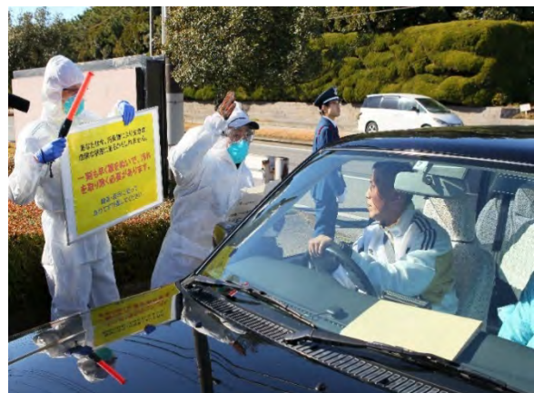
被災者受入訓練(ゲートコントロール) 【千葉県救急医療センター】