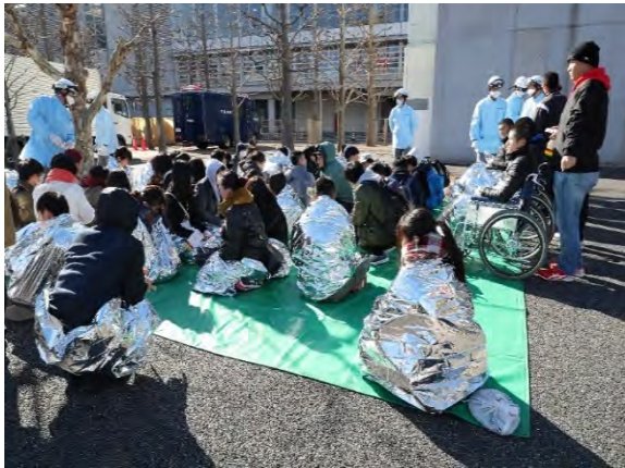
応急救護訓練(緑タグ被災者) 【幕張メッセ】