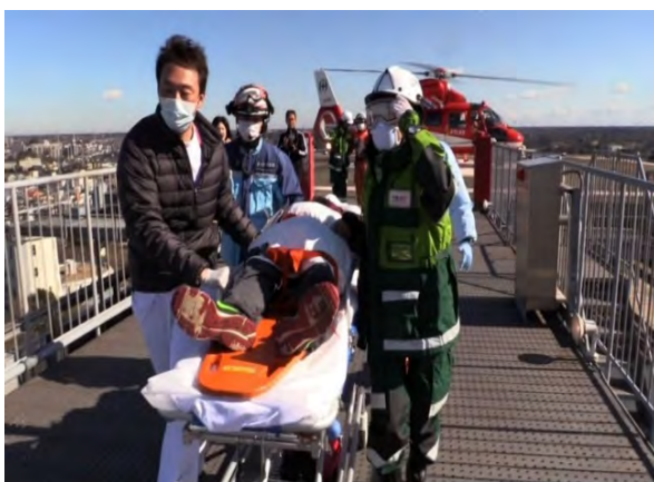
被災者受入訓練 【千葉大学医学部附属病院】