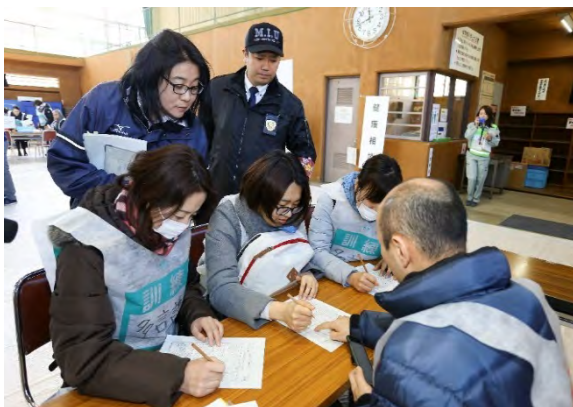
救援訓練（安否情報収集） 【幕張コミュニティセンター】