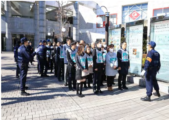
初動対処訓練（避難） 【ワールドビジネスガーデン】