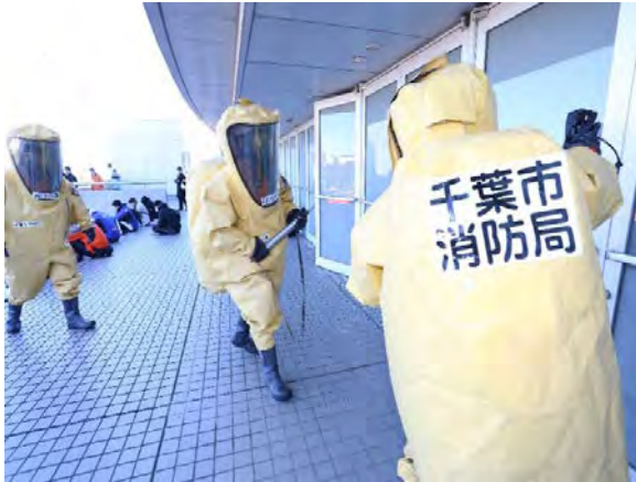
初動対応訓練（簡易検知） 【幕張メッセ】