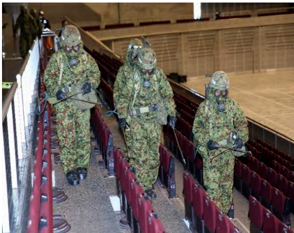
除染訓練(現場除染) 【幕張メッセ】