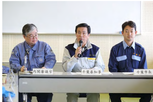
合同対策協議会運営訓練 【千葉県総合教育センター】