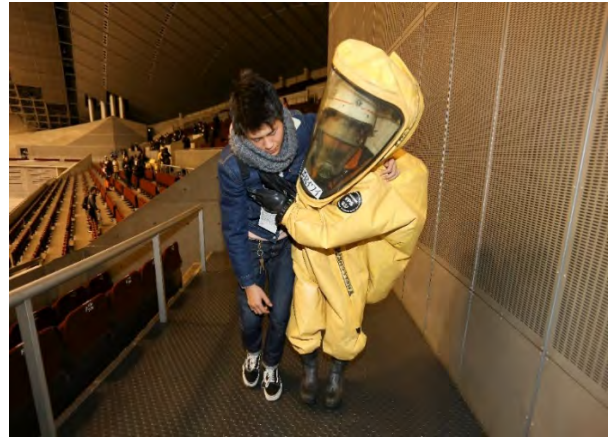
初動対応訓練（救出・救助） 【幕張メッセ】