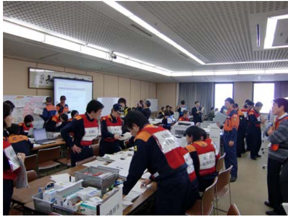
徳島県対策本部の活動状況 【徳島県庁】