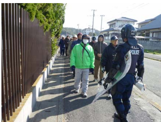
警察の誘導による住民避難 【桑島サッカー場】