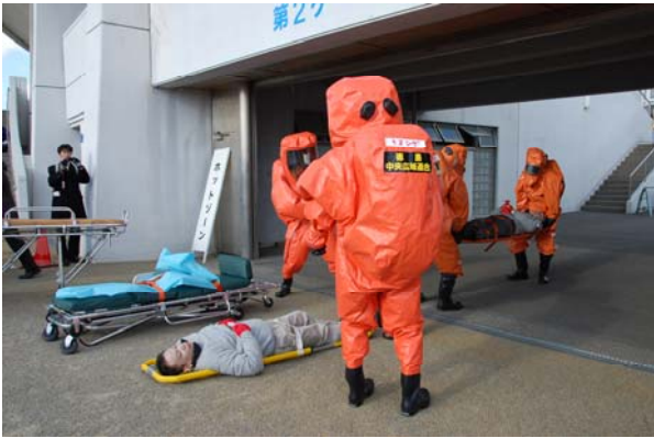
防護衣を着装した鳴門市消防による傷病者の救助活動 【鳴門・大塚スポーツパーク】