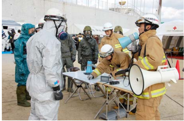
消防による現地指揮本部の運営 【鳴門・大塚スポーツパーク】