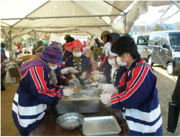
鳴門市婦人防火クラブによる避難所での炊き出し 【ウチノ海総合公園】