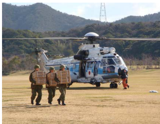
海上保安庁ヘリによる救援物資の輸送、引渡し 【ウチノ海総合公園】