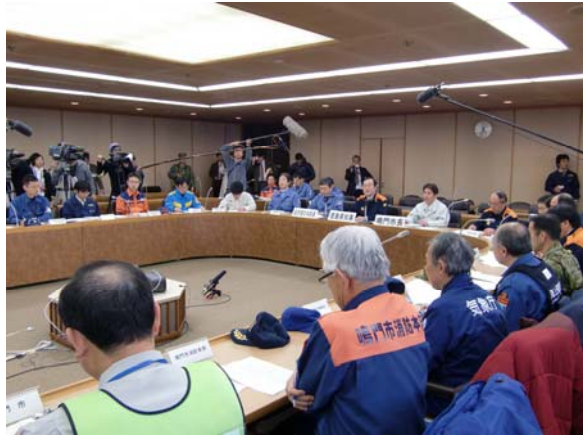
合同対策協議会の実施 【徳島県庁】