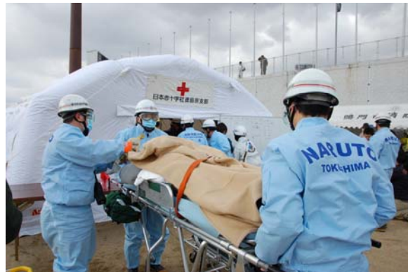
除染した傷病者の現地応急救護所への収容 【鳴門・大塚スポーツパーク】