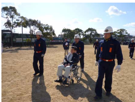
鳴門市消防団の支援による要援護者の避難 【桑島サッカー場】