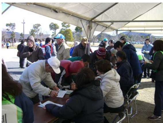
避難所における受付・安否情報の収集 【ウチノ海総合公園】