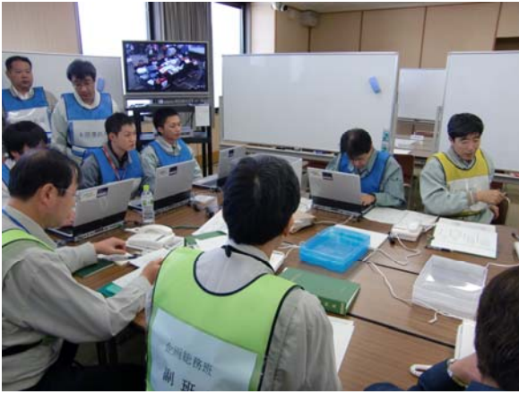
鳴門市対策本部の活動状況 【徳島県庁】