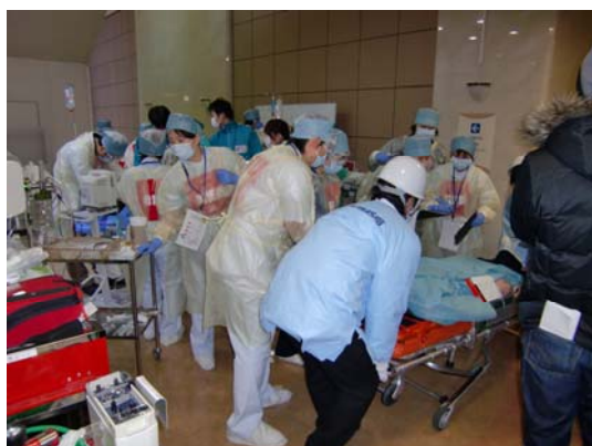
病院前除染・トリアージを終えた重症者への治療 【鳴門病院】