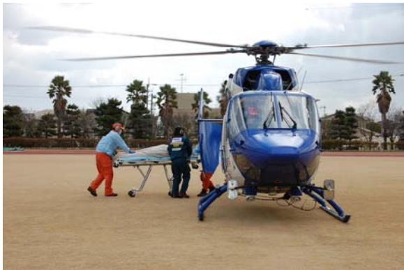
消防防災ヘリによる傷病者の搬送 【鳴門・大塚スポーツパーク】