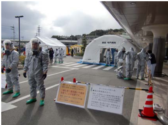
来院者に対する病院前でのゲートコントロール 【鳴門病院】