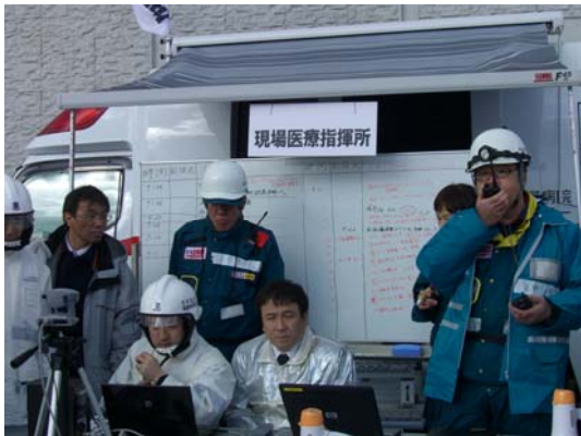
現地医療指揮本部の活動状況 【鳴門・大塚スポーツパーク】