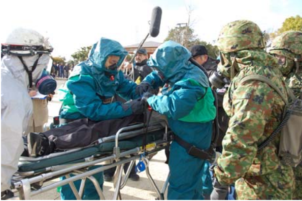
除染前医療の実施 【鳴門・大塚スポーツパーク】