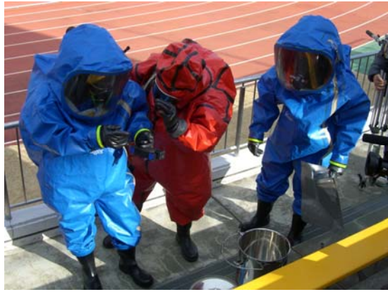
警察による化学剤の検体採取 【鳴門・大塚スポーツパーク】