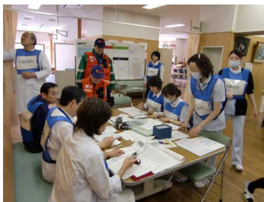
鳴門病院災害対策本部の活動状況 【鳴門病院】