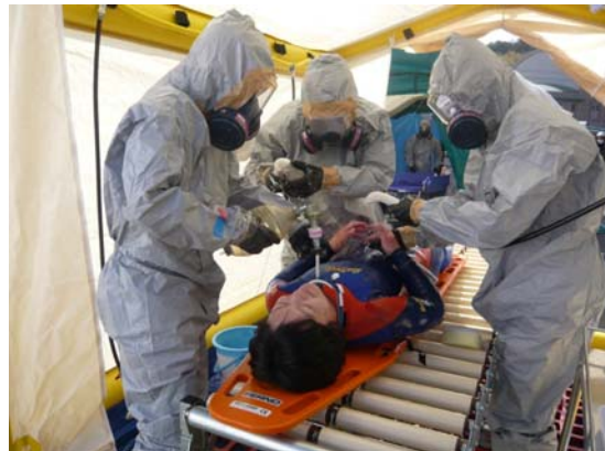
病院前での除染 【鳴門病院】