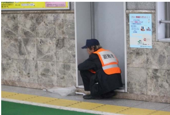
駅構内（自由通路）への避難