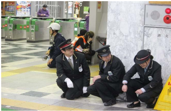
駅構内（自由通路）への避難