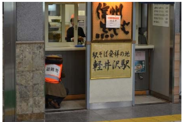
駅構内（店舗）への避難