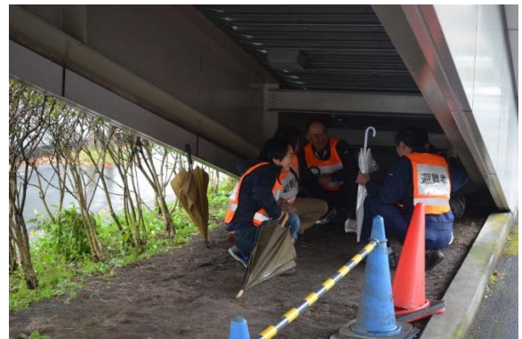
歩道橋下への避難