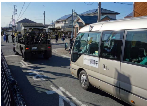
避難誘導 【JR愛野駅周辺】