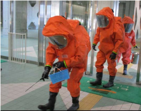
検知活動 【エコパスタジアム】