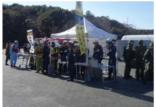
現地調整所 【エコパスタジアム】