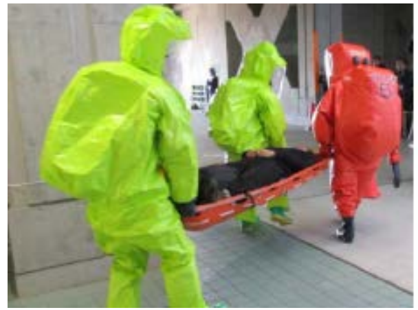
被災者の救出・搬送 【エコパスタジアム】