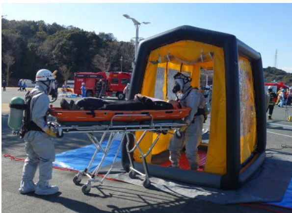
被災者の除染 【エコパスタジアム】