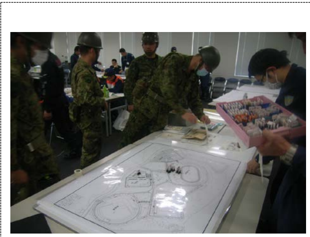
現地調整所の活動 (山梨県)