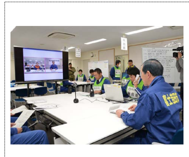
緊急対応事態対策本部会議 (富士吉田市)