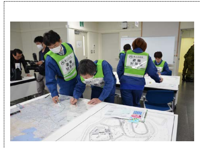
対策本部の活動 (富士吉田市)