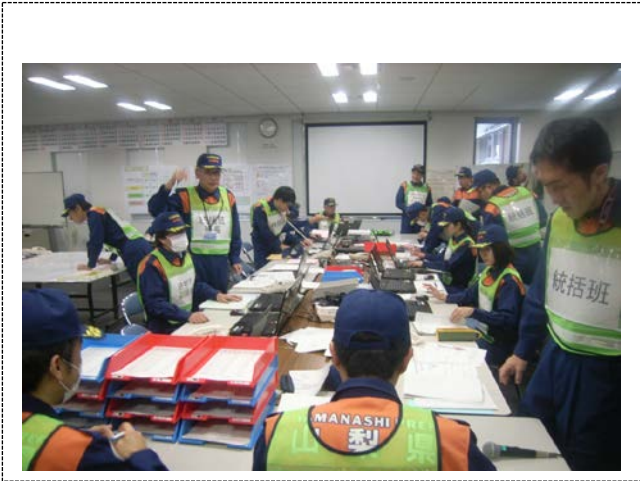
対策本部の活動 (山梨県)