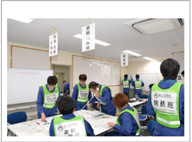
対策本部の活動 (富士吉田市)