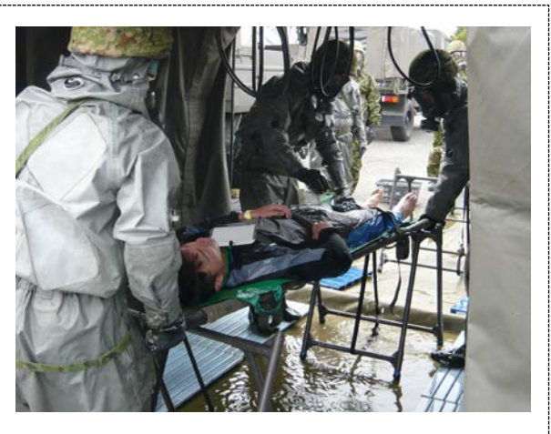
NBCR検知・除染訓練 (大分銀行ドーム)