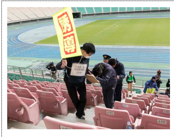
避難・誘導訓練 (大分銀行ドーム)