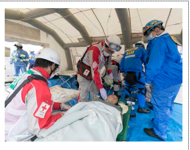
救命・救助訓練 (大分銀行ドーム)