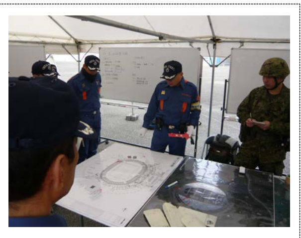
指揮所訓練 (大分銀行ドーム)