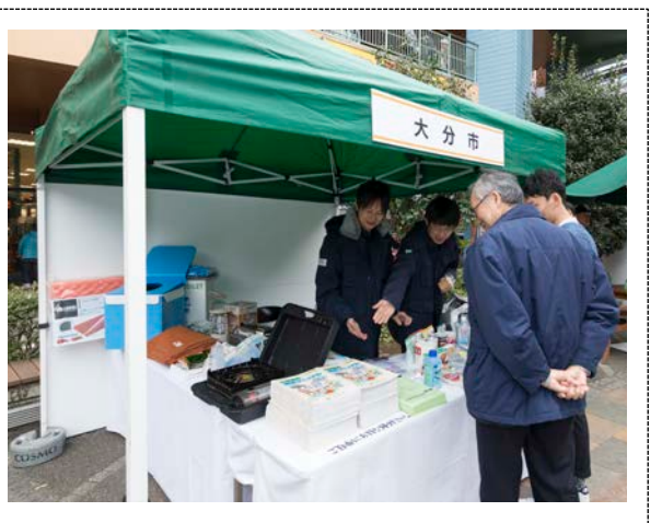
県民意識高揚展示ブース (パークプレイス大分)